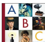
Prestel Museums, ABC München , Prestel Verlag, 2004

Il sogno di Matteo , capolavoro di Leo Lionni , è una storia di emancipazione attraverso l'arte. Una gita al museo segna il destino di un piccolo topo, da una soffitta polverosa alla fama internazionale (e all'amore). Per la vulcanica maialina Olivia , uscita dalla matita di Ian Falconer , l'incontro al museo con Degas e Pollock è il cuore di una giornata frenetica di sperimentazioni, guai e scoperte. Nello splendido albo di Susanna Mattiangeli e Vessela Nikolova tra le sale affollate e piene di vita c'è invece lo sguardo di un'infanzia a caccia di segreti, e come per il topolino Matteo, perdersi è un po' trovarsi.