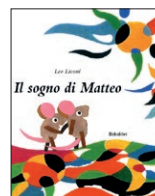
Leo Lionni, Il sogno di Matteo , Babalibri, 2007