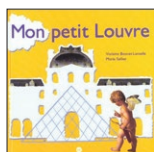
Marie Sellier, Mon petit Louvre , Réunion des musées nationaux, 2001