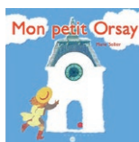
Marie Sellier, Mon petit Orsay , Réunion des musées nationaux, 2001